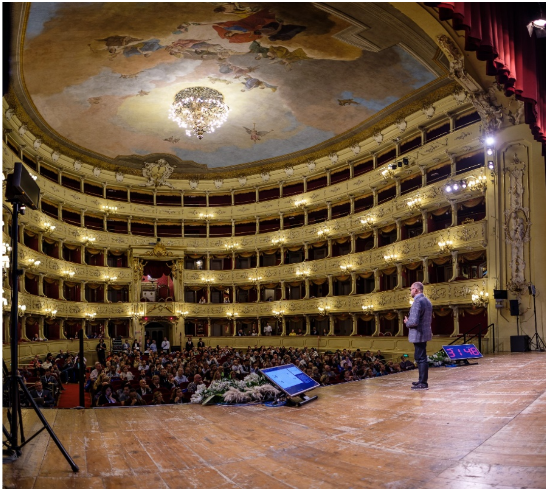
Vacation Rental World Summit 2019 au Teatro Sociale, à Como, en Italie