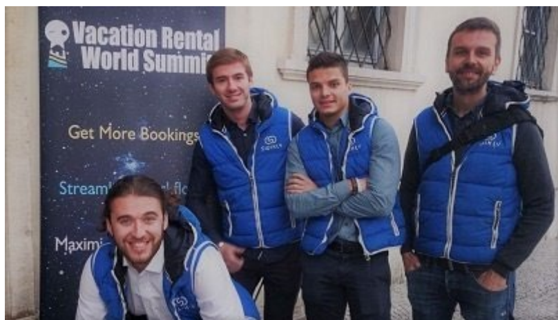
L'équipe Swikly au Vacation Rental World Summit

Mais surtout, Swikly a eu l'honneur d'être sélectionné pour la finale du concours VRWS, avec le vote du public, et nous vous remercions encore ! Cet événement nous a permis de présenter notre offre de caution en ligne mais aussi de développer notre notoriété dans le secteur de la location saisonnière , d'établir des partenariats stratégiques et nous a propulsé pour réaliser une superbe année 2019. Alors si vous êtes acteur de la location saisonnière et que vous hésitez encore à participer au VRWS... N'attendez plus !